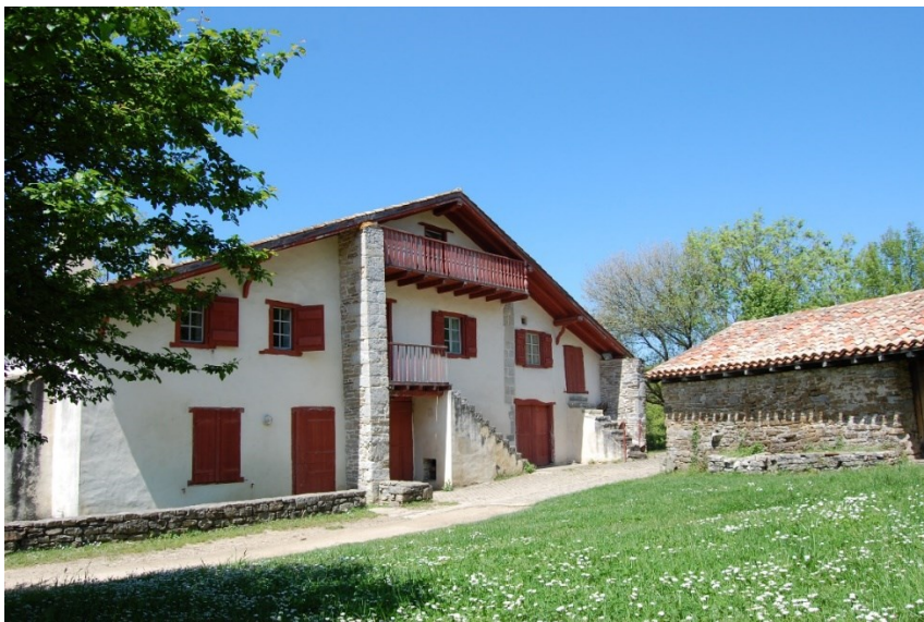
Abbadia eremuko Nekatoenea egonaldi tokia